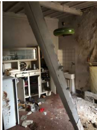
Stanza 2 (cucina)