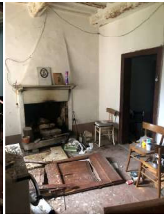
Stanza 3 (cucina)