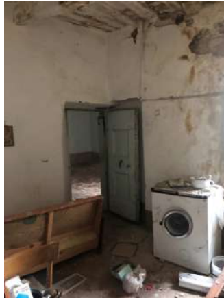
Stanza 3 (cucina)