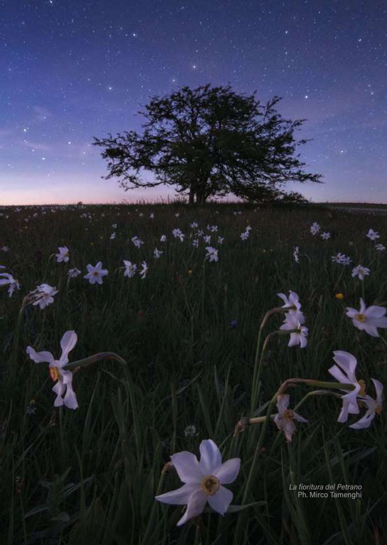
La fioritura del Petrano